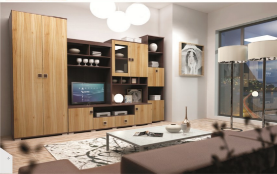
Klasykny i elegancy zestaw mebli - idealny do małego pokoju

Meblistyka dostępna w kolorze: WENGE/ORZECH LION, WENGE/ŚLIWA