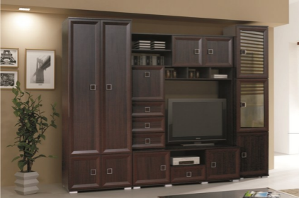
Klasykny i elegancy zestaw mebli - idealny do małego pokoju