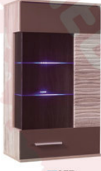
LED BC5 60x106x34cm