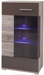
LED BC5 60x108x34cm