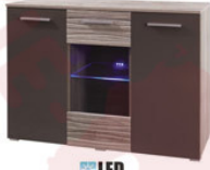
LED BC2 120x85x41cm