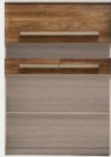
nadstawka CH5 158/110/31