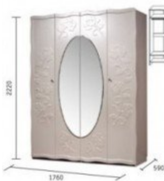
Шкаф для одежды "Тайна" КМК 0416.1 1760 x 2220 x 590