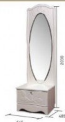
Тумба туалетная "Тайна с зеркалом" КМК 0416.7 645 x 2030 x 485