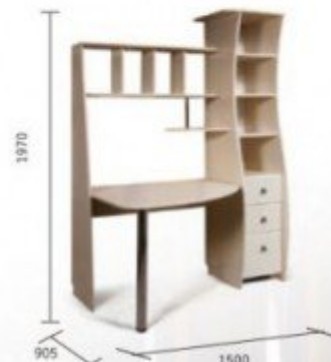
Стол для компьютера "Тайна 01" КМК 0416.13 1500 x 1970 x 905