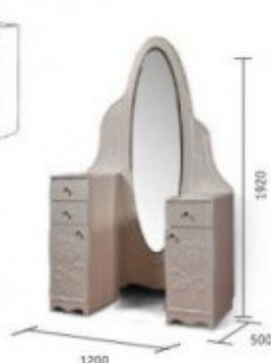
Стол туалетный "Тайна" КМК 0416.5 1200 x 1920 x 500