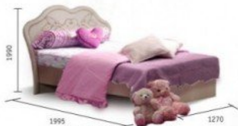
Кровать 900 "Тайна" КМК 0416.11 1990 x 1995 x 1270 матрас 1950 x 900