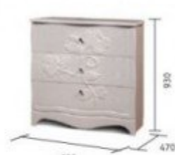
Комод "Тайна" КМК 0416.2 930 x 950 x 470