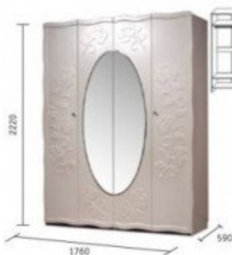
Шкаф для одежды "Тайна" КМК 0416.1 1760 x 2220 x 590