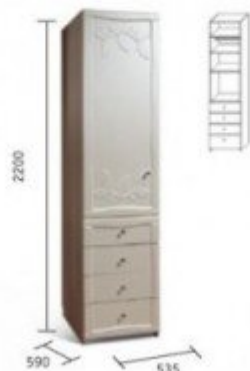
Шкаф для одежды "Тайна 1Д4Я" КМК 0416.10 535 x 2200 x 590