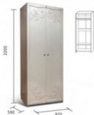
Шкаф для одежды "Тайна 2Д" КМК 0416.9 875 x 2200 x 590