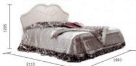
Кровать "Тайна" КМК 0416.4 1990 x 1205 x 2110 матрас 1950 x 1600