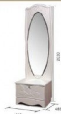
Тумба туалетная "Тайна с зеркалом" КМК 0416.7 645 x 2030 x 485