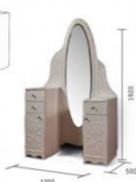
Стол туалетный "Тайна" КМК 0416.5 1200 x 1920 x 500