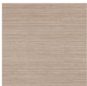
dąb czesany -