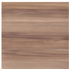
śliwa wallis -