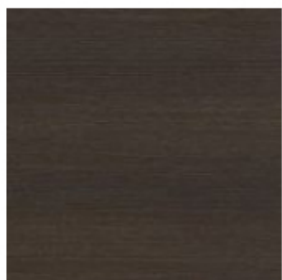
dąb wenge ciemny -