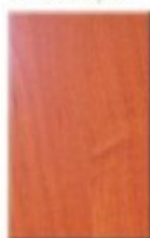
Alder Mountain Dark