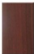
Walnut Bologne Dark