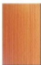
Beech Bavaria Light