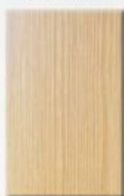
Cedar Atlas Light