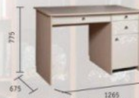
Стол для компьютера "Тайна 02" КМК 0416.14 1265 x 775 x 675