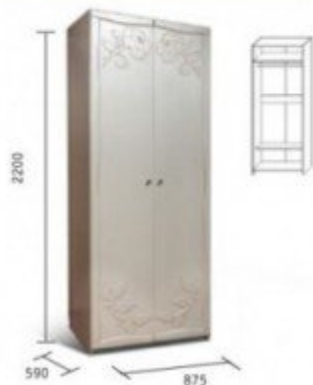
Шкаф для одежды "Тайна 2Д" КМК 0416.9 875 x 2200 x 590