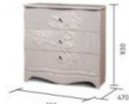
Комод "Тайна" КМК 0416.2 930 x 950 x 470