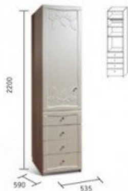
Шкаф для одежды "Тайна 1Д4Я" КМК 0416.10 535 x 2200 x 590