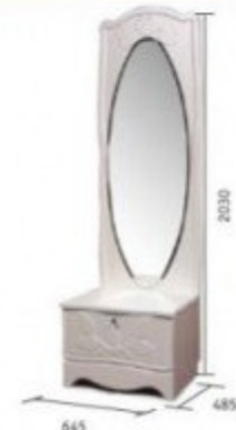
Тумба туалетная "Тайна с зеркалом" КМК 0416.7 645 x 2030 x 485