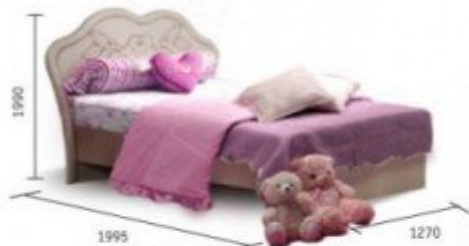
Кровать 900 "Тайна" КМК 0416.11 1990 x 1995 x 1270 матрас 1950 x 900