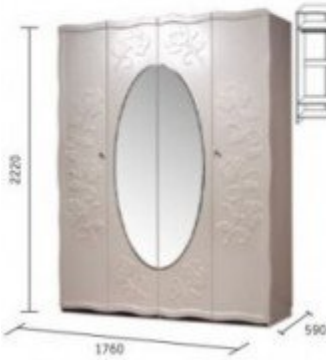
Шкаф для одежды "Тайна" КМК 0416.1 1760 x 2220 x 590