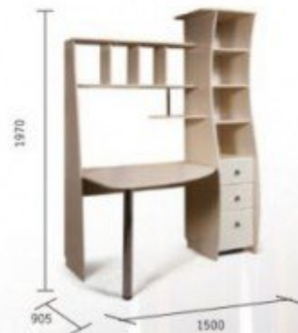
Стол для компьютера "Тайна 01" КМК 0416.13 1500 x 1970 x 905