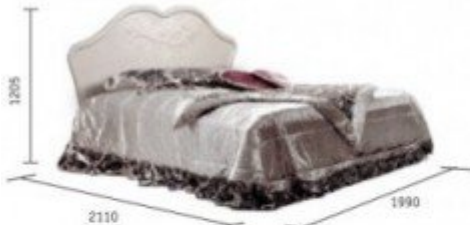
Кровать "Тайна" КМК 0416.4 1990 x 1205 x 2110 матрас 1950 x 1600 Кровать 1800 "Тайна" КМК 0416.15 1990 x 1205 x 2305 матрас 1950 x 1800