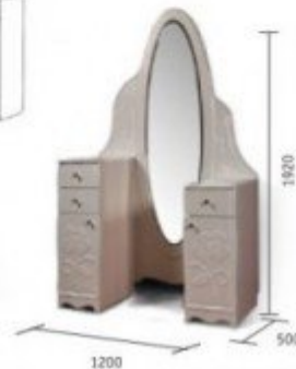
Стол туалетный "Тайна" КМК 0416.5 1200 x 1920 x 500