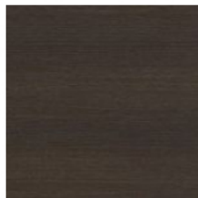
dąb wenge ciemny -